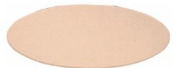
縦18(16.7) x 横43.6(42.3) x 厚1.6cm #5 オーバルボード(MDF) ¥2,457